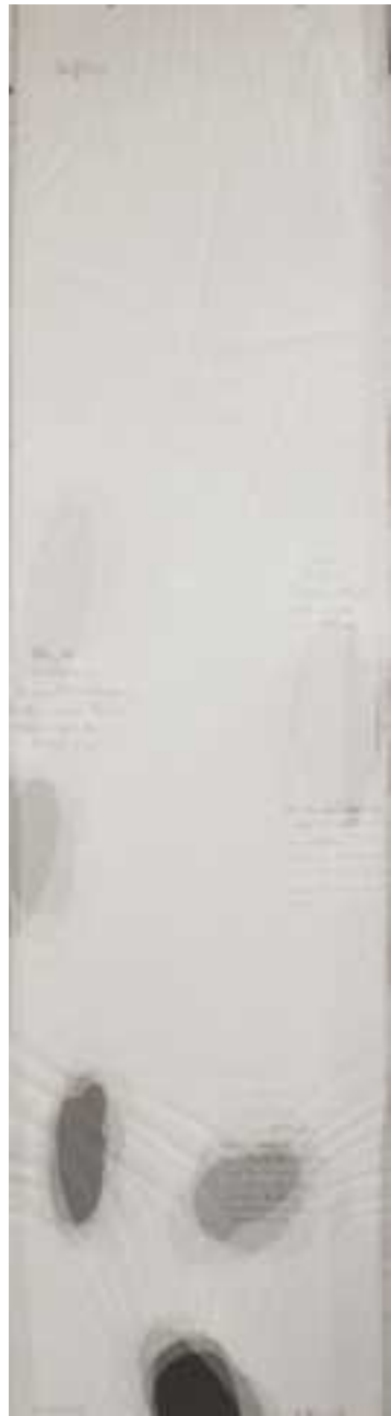
"Umzeichnung", 1980 Transparentpapier, Bleistif Im Besitz der staatl. Kunst- halle Karlsruhe

Transparentpapierzeichnungen 1978 - 1986 Transparentpapier/Bleistift/Tusche